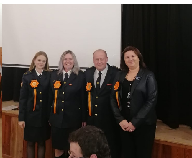
13. ledna proběhl tradiční Hasičský ples. K tanci hrála skupina Merkur.