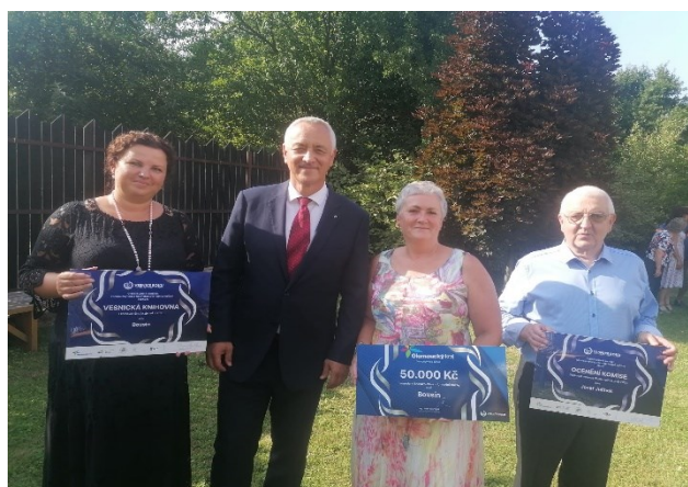
Autor: Dana Minxová